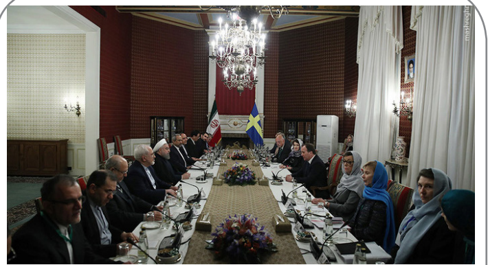
مذاکرات مشترک هیأت‌های عالی‌رتبه ایران و سوئد در تهران