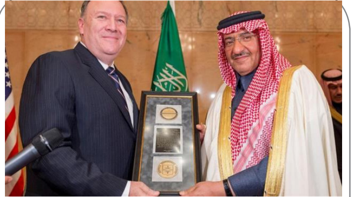
ولیعهد سعودی از سازمان سیا مدال افتخار دریافت کرد