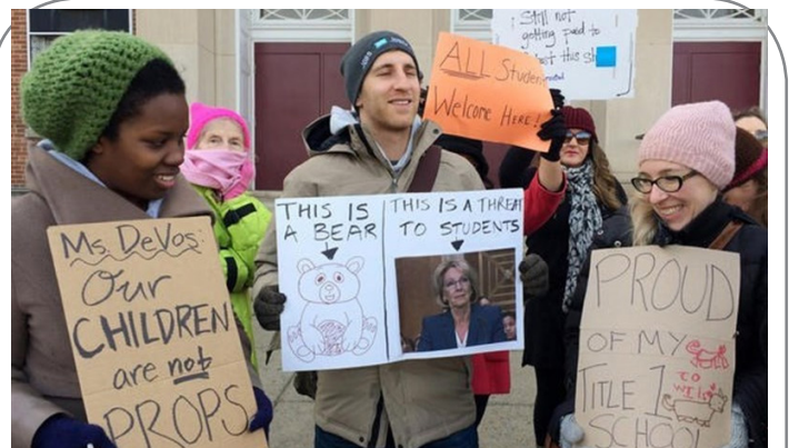
معترضان مانع ورود وزیر آموزش و پرورش ترامپ به مدرسه شدند