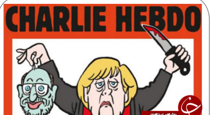
کاریکاتور مجله شارلی ابدوی فرانسه از صدراعظم آلمان؛ مرکل هم سر مخالفتش را برید!