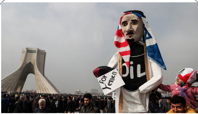
سعودی، عروسک خیمه شب بازی آمریکا و اسرائیل در یمن