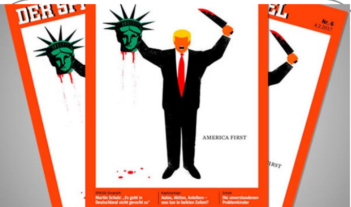
کاریکاتور مجله اشپیگل آلمان از ترامپ